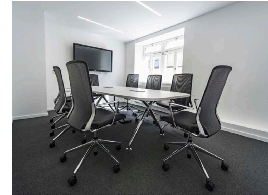
GEMÜTLICHE RUNDE: Im Besprechungsraum des Bürgermeisters kommt der Konferenztisch „xcone“ zum Einsatz, genauso wie die ergonomischen Konferenzstühle „pharao net“.

Die Tisch-Linie xcone ermöglicht beispielsweise bei Ratssitzungen trotz Beinraumblende eine große Beinfreiheit. Der Tisch lässt sich werkzeuglos de- und remontieren und speziell zugeschnittene Wagen ermöglichen einen unkomplizierten Transport des Konferenzsystems, für den Fall, dass Platz im Raum geschaffen werden muss oder die Tische zusätzlich an anderer Stelle benötigt werden. So ermöglicht das System eine schnelle Anpassung an unterschiedliche Situationen. Auch die eingesetzten klif-Stühle punktet mit ihrer Flexibilität: Sie